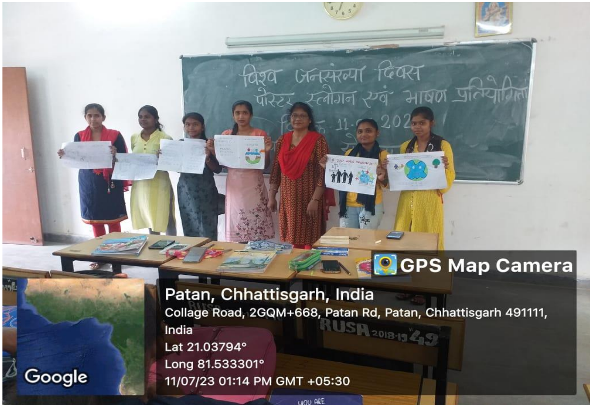
WORLD POPULATION DAY 11.07.2023