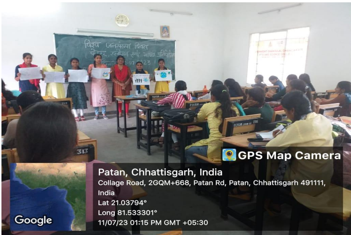
WORLD POPULATION DAY 11.07.2023